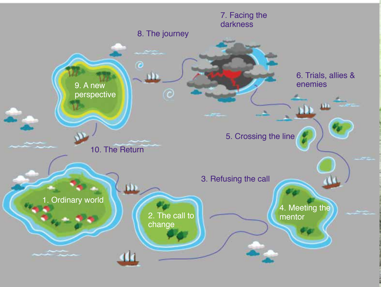
Figure 2: Le Parcours du Héros

“ Le Parcours du Héro nous concerne tous, il est ceci dit particulièrement applicable à l'aventure entrepreneuriale ”