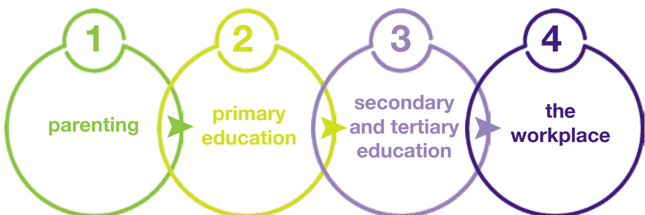
Figure 2: Phases de l'Entretien Entrepreneurial

Compte tenu de cela, nous devons faire en sorte qu'il y ait un équilibre entre la fourniture de capital financier et du capital humain pour équilibrer l'écosystème.