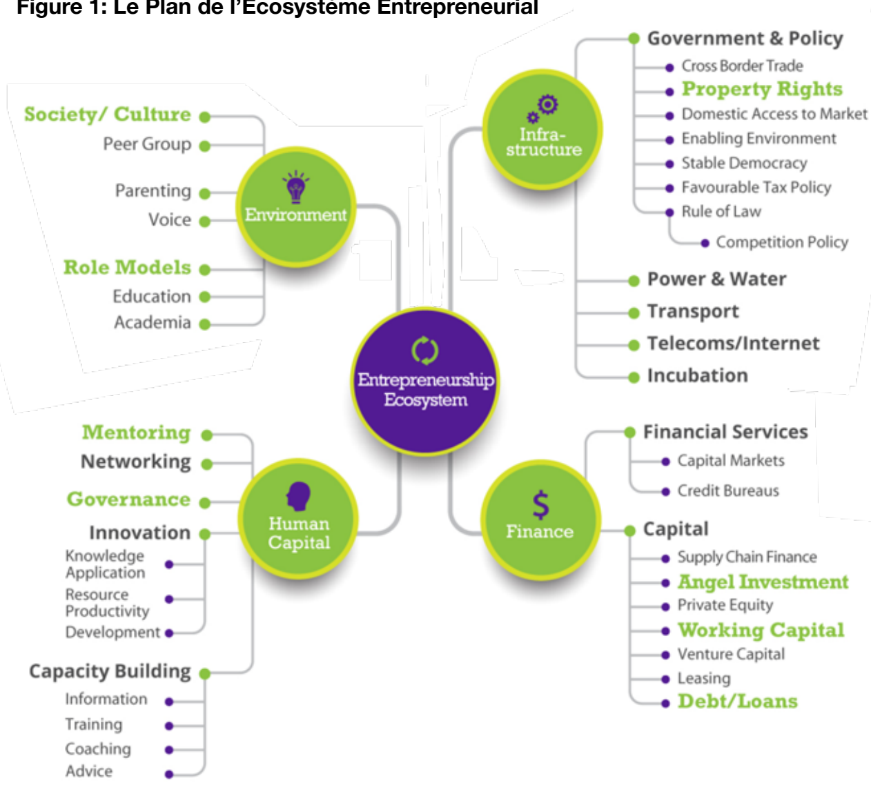
Figure 1: Le Plan de l'Ecosystème Entrepreneurial

Grâce à notre expérience dans la région, en notant les défis de nos entrepreneurs et mentors (dont beaucoup sont aussi des entrepreneurs), ceci ajouté à nos recherches sur les écosystèmes centrés sur l'entrepreneur, Mowgli a créé une carte entrepreneuriale de l'écosystème pour mettre en évidence les piliers de soutien que nous estimons être nécessaires pour véritablement développer un entrepreneuriat durable.